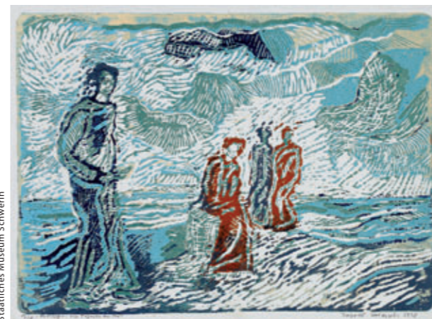
Ingrid Goltzsche: Vier Figuren am Strand | 1978 | Farblinolschnitt Staatliches Museum Schwerin