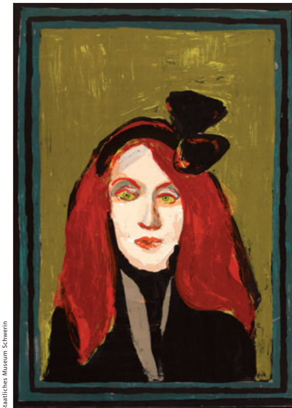
Ruth Heyder: Porträt | 1987 | zehnfarbiger Siebdruck Staatliches Museum Schwerin

14:30 Brigitta Milde (Chemnitz): Selbstbehauptung in der Nische. Vom Grafiksammeln in der DDR