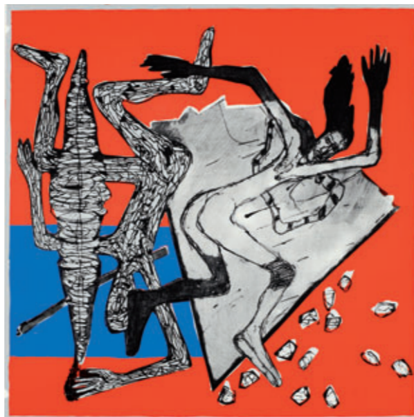
Wolfgang Smy: Giertraum | 1985 | Farbsiebdruck Staatliches Museum Schwerin

Die Tagung steht im Zusammenhang mit dem vom Staatlichen Museum Schwerin und dem Dresdner Institut für Kulturstudien initiierten überregionalen Ausstellungs- und Forschungsprojekt »Land der Grafik« und ist zugleich die 6. Tagung des Arbeitskreises »Kunst in der DDR«. Ihr Ziel ist ein formativer Beitrag zur Rekonstruktion des bislang weitgehend unbeachtet gebliebenen Kommunikationssystems »Grafik in der DDR«.