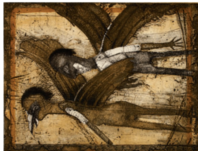
Wolfgang Domrose: Flugräume - Alpträume | 1988 | vierfarbige Radierung Staatliches Museum Schwerin

Bislang fehlt eine rekonstruierende, den spannungsvollen Zusammenhang zwischen Akteuren, Institutionen und Kunstmodellen einbeziehende Gesamtsicht auf das facettenreiche Phänomen der »Grafik in der DDR«. Diese paradox erscheinende Fehlstelle ist Ausgangspunkt der Greifswalder Tagung, die sich erstmals umfassend dieser Kunstform aus interdisziplinärer Perspektive von Kunstgeschichte, Kulturwissenschaft, Zeitgeschichte und Kunstsoziologie widmet.